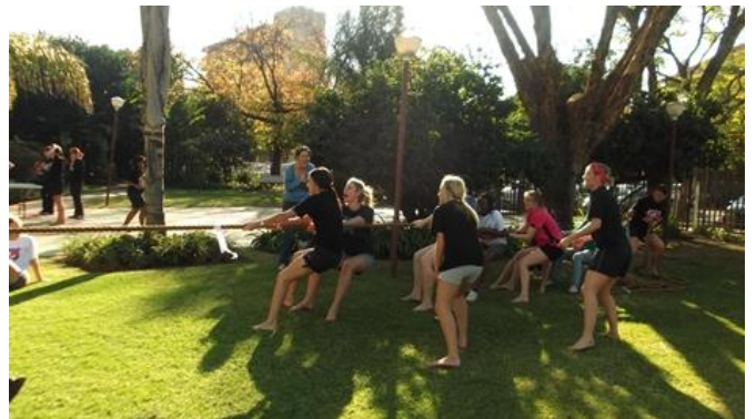
Spikkels wat hul vloer verteenwoordig by die toutrek

afgeskop met 'n regte romantiese komedie " The Vow " waar die saal omskep is in een groot pajama-partytjie en popcorn was in oorfloed!! Die Magrietjies het knus gelê en trane trek op die koue wintersaand en is vroeg in die bed om uit te rus vir die res van die naweek. Saterdagoggend was dit tyd om huis skoon te maak en voor te berei vir die voornemende Magrietjies en hul ouers. Nog voor die laaste matriek kon sê "hoop ek sien julle volgende jaar" het die eerste volleybal spel al begin. Dis reg, Magrietjie het GANGSPORT gehou. Verskeie vloere het meegeding vir die algehele wentitel in sokker, tafeltennis, volleybal, driebeenresies en eiergooi. Taabos het kom inloer om seker te maak dat die meisies by die reëls hou - en op die koop toe sommer 'n lekker Joolreünie ook. Die hoogtepunt was egter die " dance off " wat aan die einde van die uitputtende dag gehou is en hier het vloer 3 hul merk gemaak. Die algehele wenplek is gedeel deur vloer 4 en vloer 7. Die dag was 'n groot sukses en sonder twyfel nie die laaste een nie. Asof die naweek nie besig genoeg was nie, is die Sondag volgemaak met ons damesoggend waar huidige Magrietjies en hul ma's asook alumni was. 'n Naweek vol pret, ontspanning, nuwe bande en hopelik 'n tradisie wat voortgesit sal word!