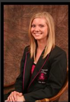
Redaktrise: Sunette Botha

Baie dankie vir julle boodskappies! Dit maak die harde werk van die nuusbriewe net 'n plesier! - Red