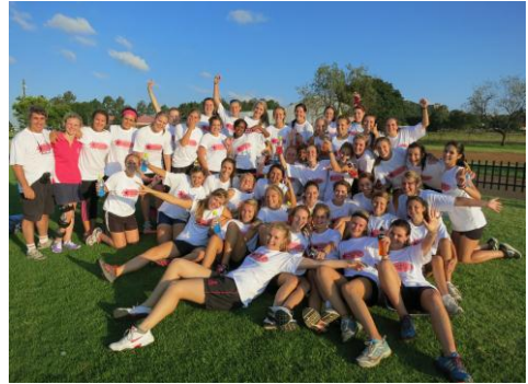
1 ste plek: Drastoel 2013

Nog nie eers vir 'n halwe dag deel van Magrietjie nie, en die Spikkels wys al klaar vir die res van TUKS hoe groot hulle pienk-passie is. Op 26 Januarie, tydens die amptelike verwelkomingsfunksie aangebied deur TUKS vir alle koshuis-eerstejaars, ding die nuwe eerstejaars mee in 'n kreet-kompetisie. Die Spikkels van Huis Magrietjie het sonder twyfel koning gekraai en vir elkeen 'n gratis pizza losgeslaan, geskenk deur TuksRes. Ons is bitter trots op ons Spikkels, wat ook sedertdien uitblink in elke geleentheid!