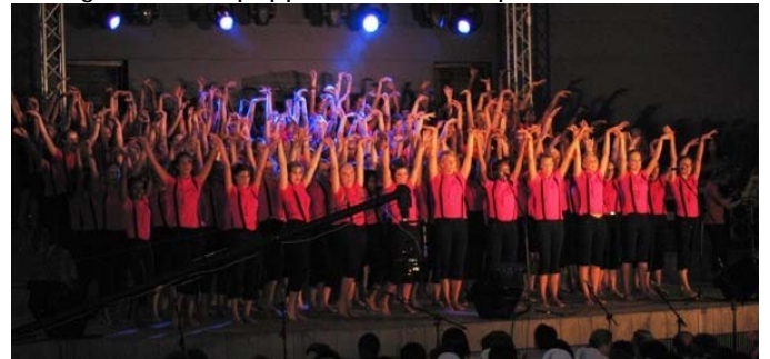
1 ste plek: Ienk-Melodienk 2009