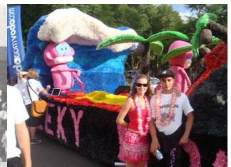
Jool met Olienhout