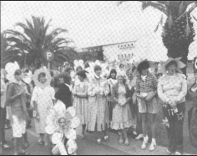
Magrietjie se 1 ste jool was saam met Landbou