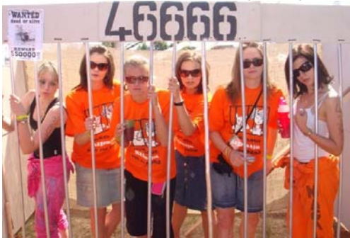
1 ste plek: Pot-en-Pons

Sedert ons laaste nuusbrieff in 2008, het Magrietjie die jaar suksesvol afgesluit met Pot-en-Pons. Wit tralies, oranje oorpakke, 'tattoos', gevlegde hare, koerant-papier-tafeldoeke en 'bunny chows'... Die klanke van blik-koppies en blikborde het almal van Magrietjie en Olienhout (alias Magsoline) laat voel soos ware kriminele ten einde in te pas by die Pot-en-Pons tronktema vir 2008. Tronkdanse het die beoordelaars se hare laat rys en die skare het omtrent om hulle saamgedrom om die gees van die Magsoline tronklewe uit te beeld. Na 'n knertsie mampoer, 'n sappige 'bunny chow' lamspotjie en 'n kleurvolle afskrif van 'n tipiese tronkvoël-foto, het die beoordelaars geen ander keuse gehad as om Magrietjie en Olienhout as die weners van Pot-en-Pons 2008 te bekroon nie (ingesluit prysgeld ter waarde van R20 000 vir jool - jippie!).