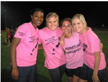
1 ste plek: HK aflos

Om 'n energieke aand te kroon, het die HK van Magrietjie die res van die HKs verbaas met 'n eerste plek in die HK aflos. Net nog 'n bewys dat die Magrietjies veelsydige dames is!