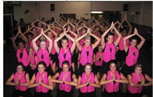
Serrie: 3 de plek in finaal