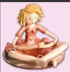
Foto van Maer-Grietjie as 'n kleipoppie. Sy bring haar dae deur in die Argiefkamer en kom net uit tydens huisvergaderings en spesiale geleenthede.