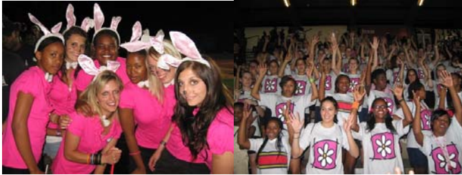
1 ste plek: Geesbeker & 2 de plek: Atletiek

Na 'n suksesvolle oriënteringsweek het die Spikkels Magrietjie se naam weereens hoog gehou by die lenkatletiek. Magrietjie het die Geesbeker gewen (3 de jaar in 'n ry) en het ook 'n algehele 2 de plek behaal op die atletiekbyeenkoms (met die dagstudente in 1 ste plek). Magrietjie se gejuig het uitgestyg bo al die ander se stemme, veral toe 'n trotse Spikkel besluit het om die 100 meter naellope te HUPPEL, eerder as te hardloop!!