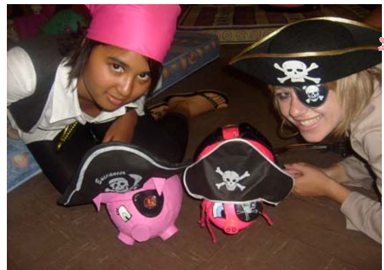
(b) Twee entoesiastiese Spikkels by hul Grietjie Piggies

Jaarliks het Magrietjie 'n skoonheidskompetisie met 'n verskil - die skoonheidskompetisie is spesiaal vir varkies. Ja inderdaad, elke Spikkel moet 'n spaarvarkie maak voor hul in die koshuis intrek, en dit met kleingeld vul. Een aand daar dan 'n spesiale modeparade gehou waar beide die varkie en die varkie se eenaar hulle tema moet uitbeeld op die loopplank. Pryse word gegee vir die "swaarste varkie", die "mees oorspronklike varkie" en vele ander kategorieë. Die geld wat ingesamel word uit Grietjie Piggy is deel van ons Jool-fondsinsameling en dié jaar het ons 'n volle R9 000 ingesamel as deel van ons bydrae om minderbevoorregte mense te help.