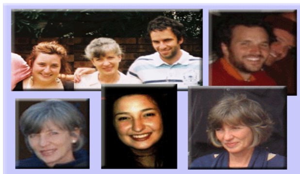
Die 1ste huismoeder met haar familie vandag