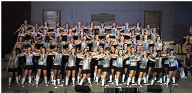
1 ste in Serrie 2010

Magrietjie het dit weer gedoen!! 2010 se Serrie wenners is die dames in pragtige pienk! Weke se voorbereiding met laat aand het uiteindelik vrugte afgewerp vir die moeë dames. Die "skeidregters" van Magrietjie in hul swart-en-wit monderings het die trofee voor al die mededingers weggeraap. Buiten 'n eerste-plek in die finaal het Magrietjie ook die uitdunronde en die "beste ontvangs by die koshuis" pryse gewen. Dit is baie duidelik dat die meisies in pienk (en op die aand in swart-en-wit) die vertoning oorheers het. Klaradyn was in die tweede plek met Asterhof wat die derde plek ingeneem het. Die wenners van die Serrie se mansafdeling was die "Toysoldiers" van Vividus (dagstudentehuis) wat ook die algemene wenners was. In die tweede plek was Boekenhout met Maroela in die derde plek.