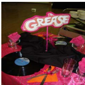
(links) Voorbeeld van 'n tafel versier volgens die Grease tema

In ware Magrietjie styl was dit weereens tyd vir die pienk dames se "Informal". Uitgevat volgens die tema "a night at the theatre" het die dames Magrietjie se eetsaal in 'n ander wêreld omskep. Van Tinkerbelle en Peter Pan, tot Lady Macbeth en Pocahontas het opgedaag om die aand op te tower. Elke tafel is versier volgens 'n Broadway Show tema. Les Miserable, Cinderella en Mamma Mia het hulle vertoning gemaak op die dekorfront. Die informele gevoel is versterk met "hamburgers en chips" as aandete.