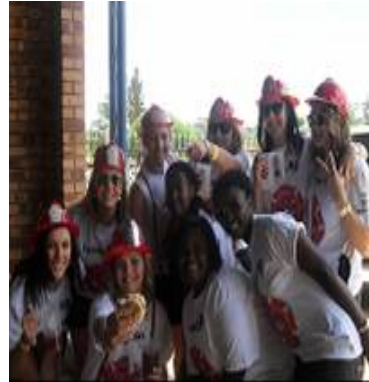
Magsidus by Pot en Pons