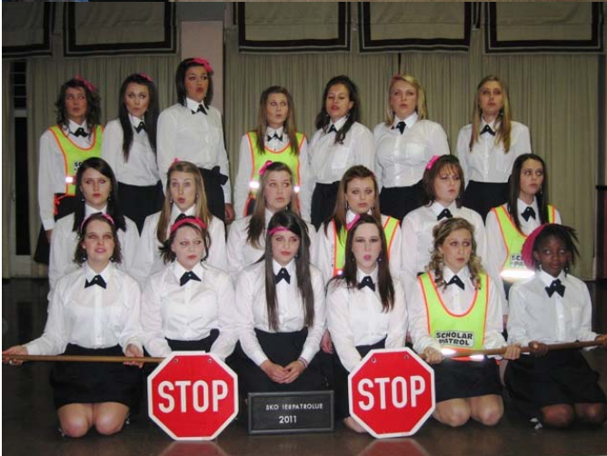
Magrietjie Serenade tydens die finaal